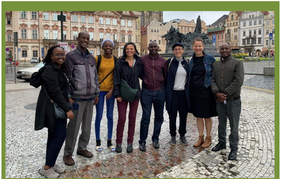
Die Projektgruppe in Prag.

Nachdem coronabedingt Dienstreisen längere Zeit nicht möglich waren, fand im September 2022 das erste Treffen aller Partner aus Benin, Kenia und Deutschland statt. Die Zwischenergebnisse der unterschiedlichen Arbeitsgruppen wurden erst beim Projektkoordinator, dem Deutschen Institut für tropische und subtropischen Landwirtschaft (DITSL) in Witzenhausen besprochen und die weitere Zusammenarbeit geplant.