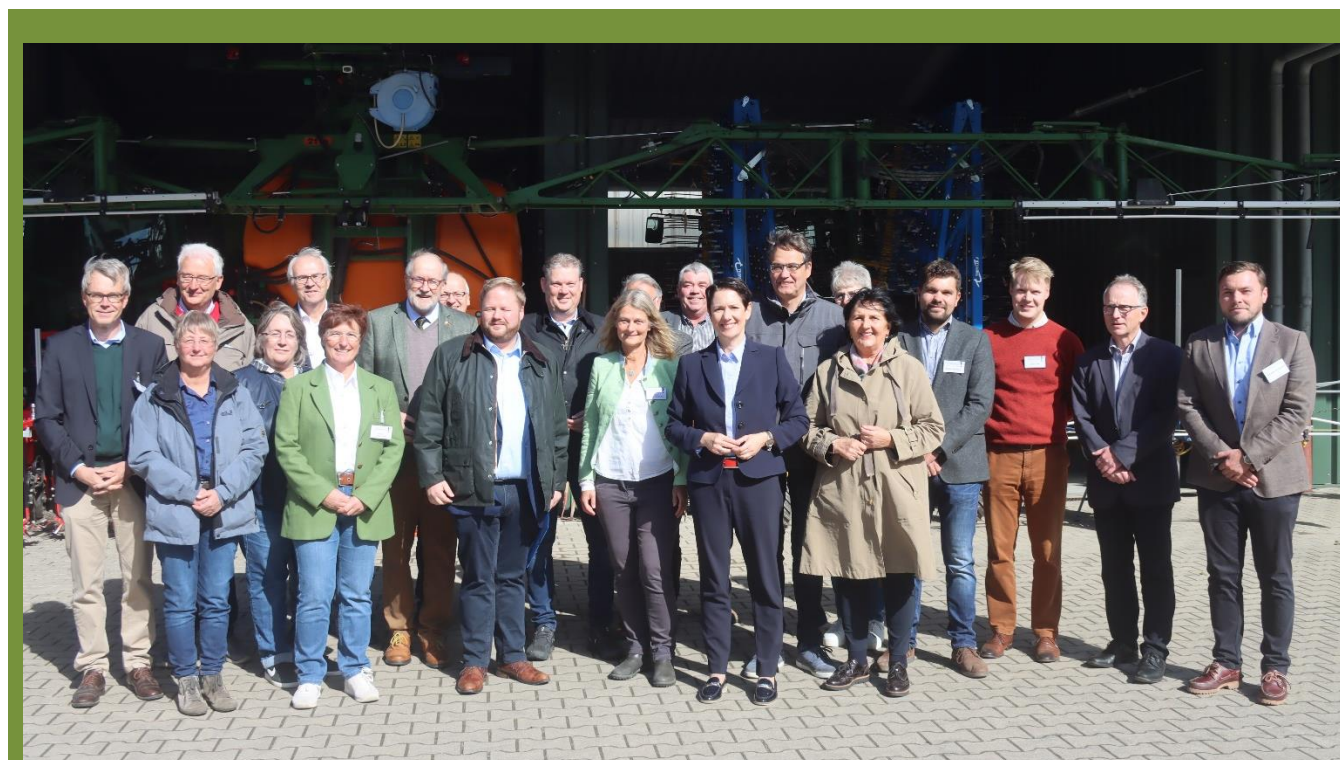
Die Teilnehmer rund um die Professor*innen des Fachbereichs Agrarwirtschaft.

Kammer und WLV, aber auch der Leitung der ABU Soest über die negativen Auswirkungen für Betriebe, Produktion und kooperativen Umweltschutz. Alle Anwesenden waren überzeugt, dass eine argumentative Grundlage für das