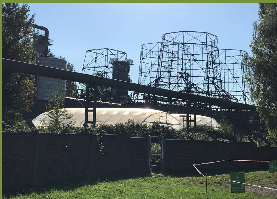
Die beiden neuen Aquaponik-Gewächshäuser des EU-Projekts ProGiReg vor der imposanten Kulisse der ehemaligen Kühltürme der Dortmunder Kokerei Hansa.