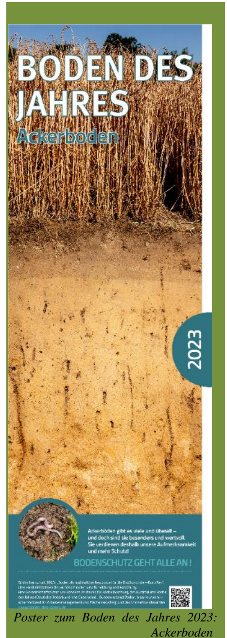
Poster zum Boden des Jahres 2023: Ackerboden