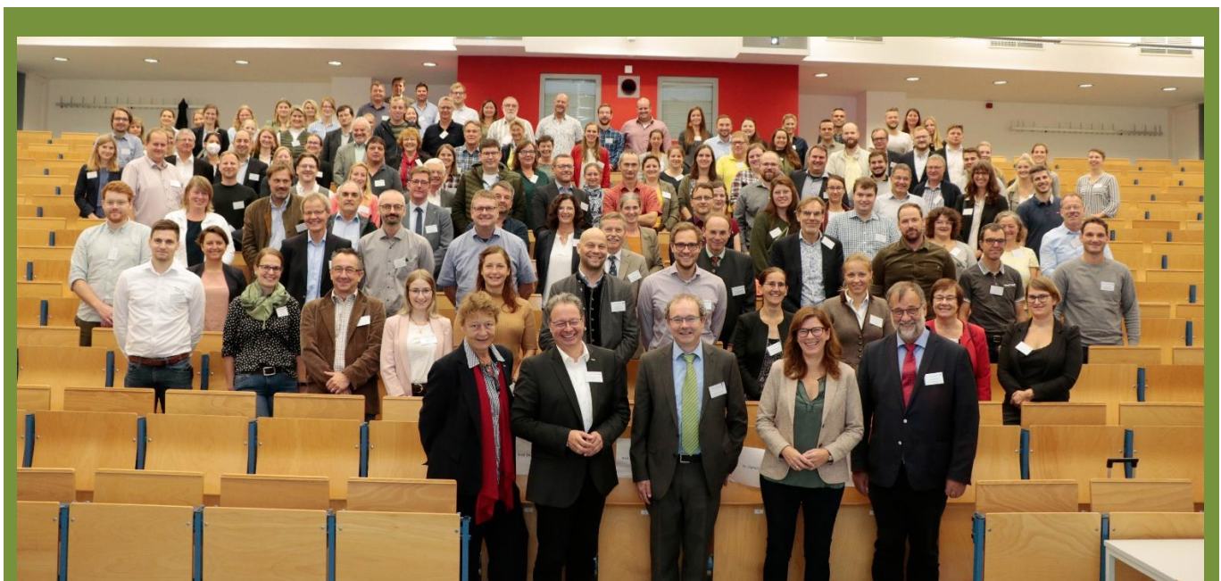
Teilnehmer der BTU Tagung auf dem Campus in Soest.

Digitalisierung in der Tierhaltung thematisiert – auch vor dem Hintergrund, inwieweit Digitalisierung zur Vereinbarkeit von Tierwohl und Emissionsschutz beitragen kann. Weitere zukunftsorientierte Fragestellungen wie das Thema Insektenhaltung als mögliche Proteinquelle in der Nutztierhaltung waren Thema und werden im Tagungsband wissenschaftlich erörtert ( Arp Hinrichs ).