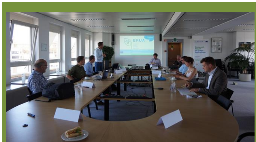
Policy Talk: "UA and CAP" KoWi, Brüssel.

Die Serie der Policy Talks wird im Januar 2023 in Brüssel fortgesetzt und Ende April 2023 findet die EFUA