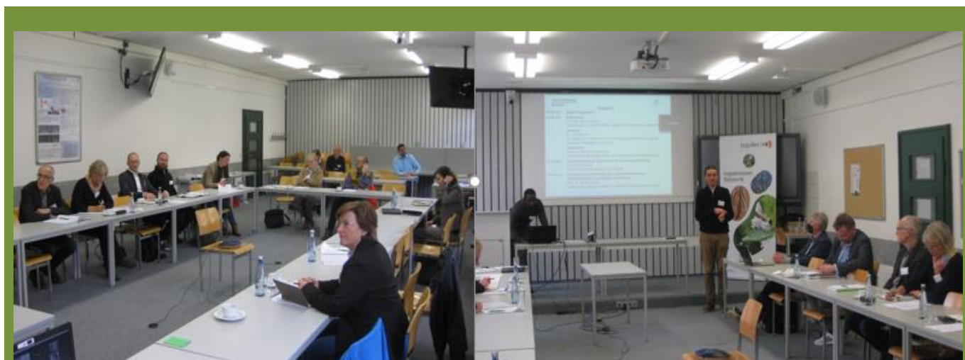
Teilnehmende des Workshops im Hörsaal am Fachbereich Agrarwirtschaft.

Inhaltlich wurde über die Herausforderungen in der Leguminosenzüchtung, die Aspekte des Leguminosenanbaus unter Berücksichtigung der Wirtschaftlichkeit und Risiken des Anbaus, den