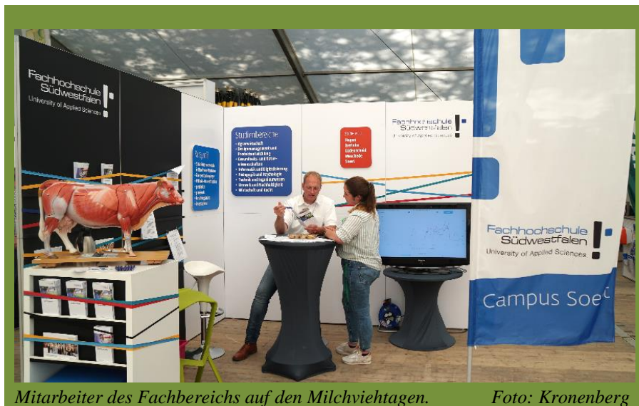
Mitarbeiter des Fachbereichs auf den Milchviehtagen.