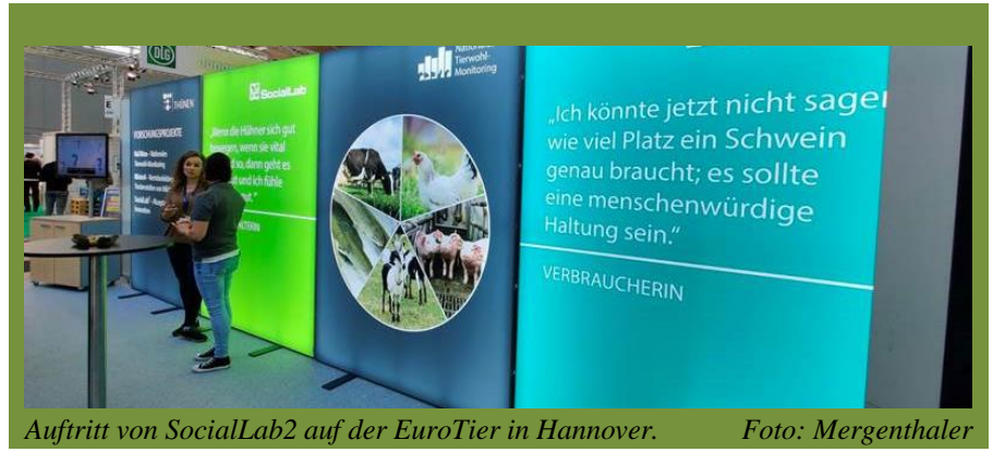
Auftritt von SocialLab2 auf der EuroTier in Hannover.